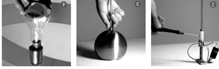
100W Decor silver 240V - E27 included CE I Class - IP 20 - Made in Italy